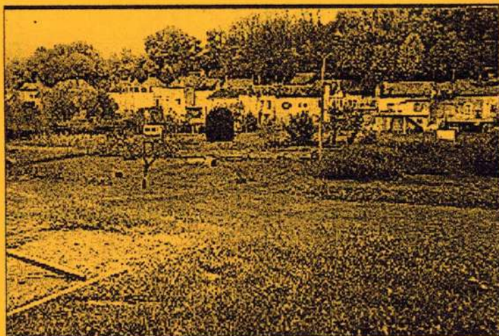
Salicetum et Jardin d'osier à Villaines les Rochers

Pour plus d'information, vous pouvez contacter la Mairie de Villaines